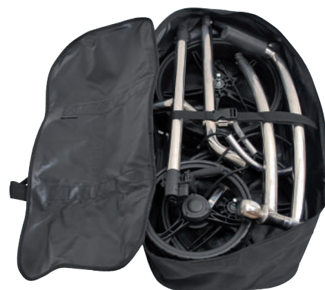
Sac de transport